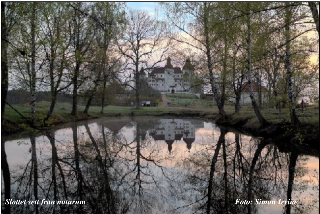
Slottet sett från naturum