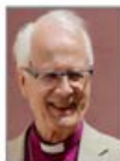
ORDFÖRANDE HAR ORDET