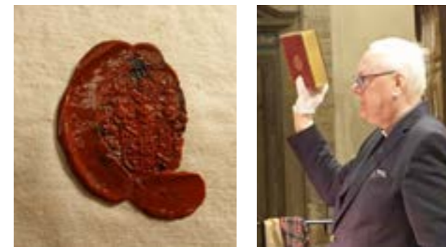
Boksigill, Carolina Rediviva, Uppsala. Föredragshållaren, Varnhem

Lunds universitet grundades 1668 och Skånes gods fick efter hand nya svenska ägare. Det hände alltså mycket, men det mest avgörande var ändå kollisionen mellan de adliga aristokraterna och Karl XI. Han kröntes 1675 och såg omgående till att riksdagen reducerade riksrådets inflytande. Det karolinska enväldet såg här sin början. Magnus Gabriel drabbades också och fick lämna sin post som rikskansler 1680. Året därpå granskade statskontoret förvaltningen av ekonomin för Uppsala universitet, och även den åtgärden kastade sin skugga över honom. Och så följde som vi vet reduktionen. Magnus Gabriel de la Gardie förlorade sin jordiska makt, men ryktet om en osedvanlig livsgärning med vårt lands bästa för ögonen, det ska vi inte låta kvävas. "Non nisi ad unum" . "Jag frågar bara efter ett enda".