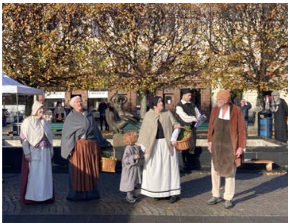
Seniorgruppen på Esplanadteatern deltog i firandet av Magnus Gabriel De la Gardie genom att framföra ett skådespel på 15 minuter på Nya stadens torg.