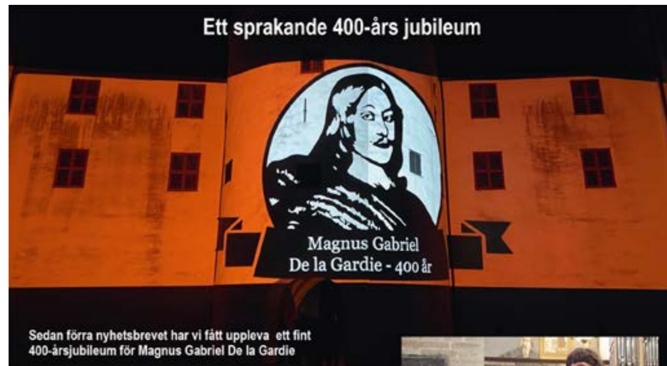
Sedan förra nyhetsbrevet har vi fått uppleva ett fint 400-årsjubileum för Magnus Gabriel De la Gardie