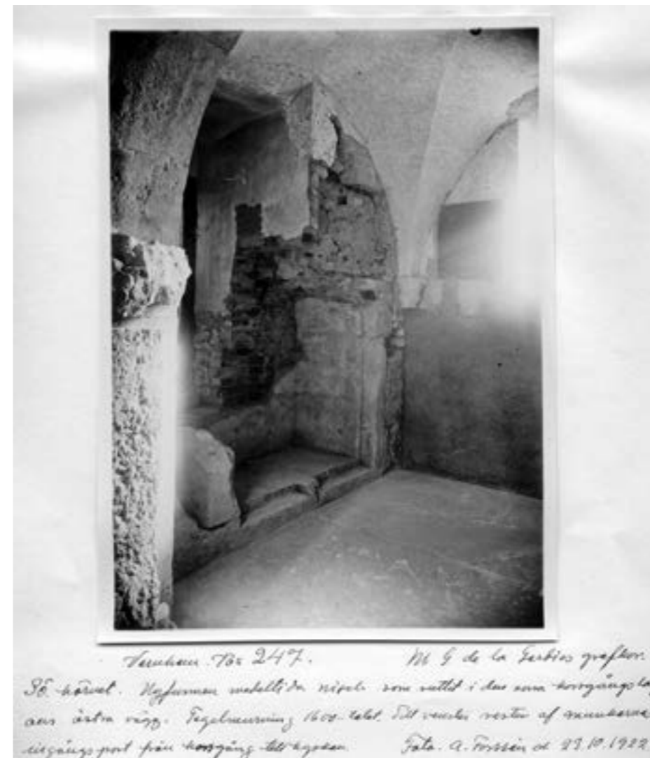
Axel Forsséns fotografi av den år 1922 återfunna nischen för klostrets bokskåp i De la Gardies gravkammare.

Utvändigt smälter makarna De la Gardies gravkammare ihop med den medeltida arkitekturen. Foto: Robin Gullbrandsson.