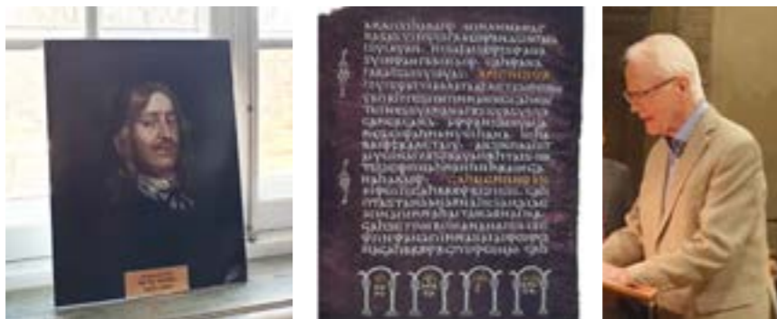
Porträtt i fönstersmyg. Sida ur Silverbibeln från 500-talet. Carolina Rediviva, Uppsala. Föredragshållaren, Varnhem.