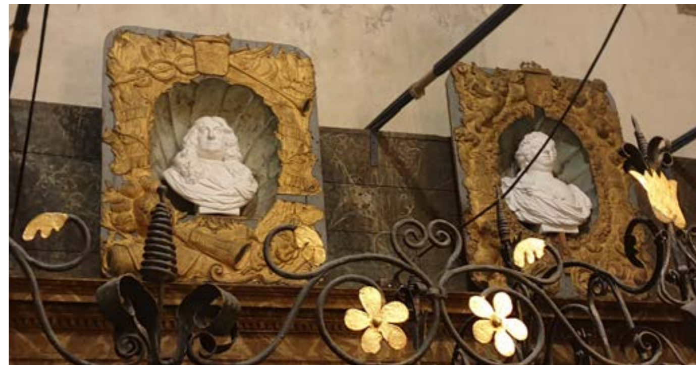
Gravkor i Varnhems klosterkyrka

Där stannade han inte länge. Nu blir han president i