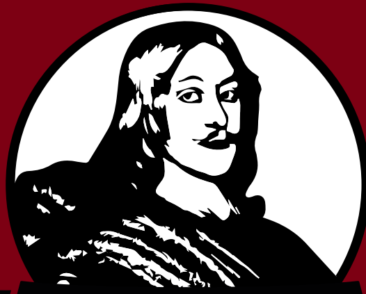
Magnus Gabriel De la Gardie - 400 år