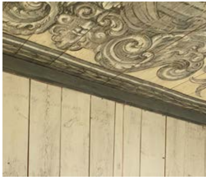
Biblioteksrummet på Läckö slott. Fortfarande syns spår efter hyllplan och bokgenre.

libris på sina böcker d.v.s. ägarstämpel på frampärmen. Men det förekom även lacksigill i svart och rött lack i böckerna där hans vapensigill präglades. Många av deras böcker är lätt igenkända då de är bundna i röd eller brun marokäng.