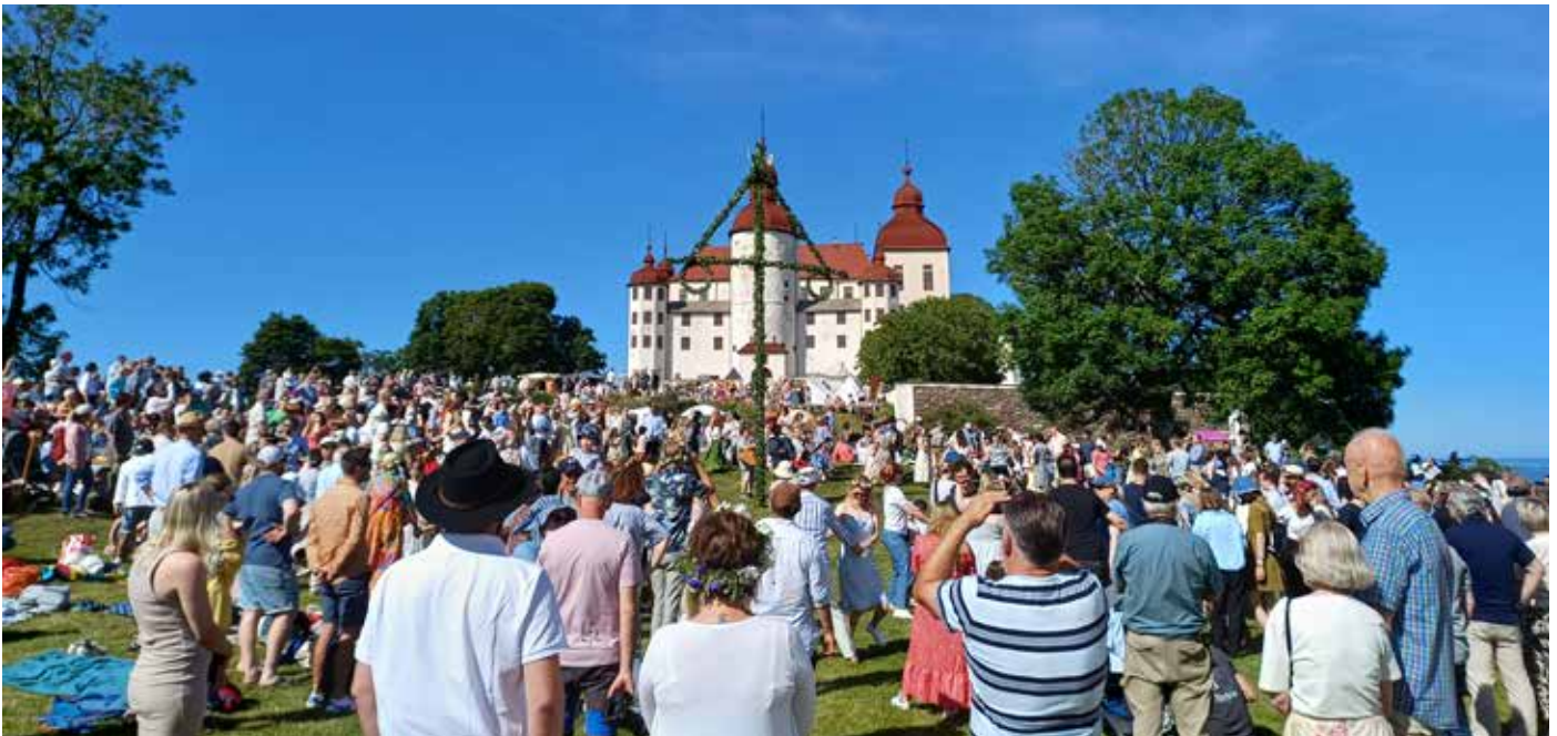
Midsommar på Läckö.