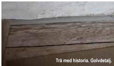
Trä med historia. Golvdetalj.