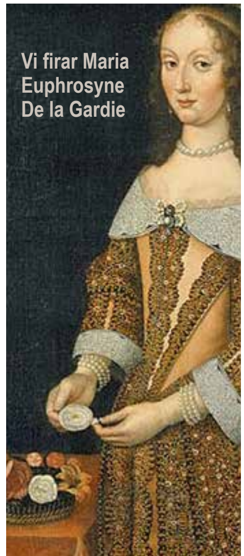
Vi firar Maria Euphrosyne De la Gardie