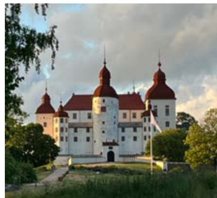
Besök på Läckö.

Min pappa var konstsamlare och en flitig besökare av konstgallerier och konstmuseer. Jag följde under min barndom regelbundet med honom på hans vernissagerundor vilket väckte ett konstintresse hos mig som sedan har hållit i sig och som jag själv har fått fortsätta att odla tillsammans med min egen familj. Därför är det så fantastiskt att ha fått den hedrande