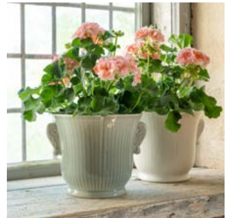
Jubileumskrukan. Som Läckövän har du 10% på hela sortimentet i slottsbutikerna.